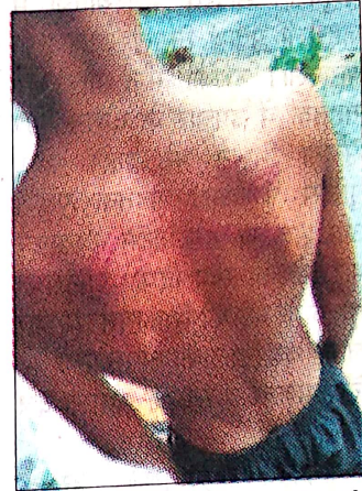
धरुहेड़ा में टीचर द्वारा की गई पिटाई

जिला के गांव खरखड़ा स्थित सरकारी स्कूल में एक टीचर द्वारा बच्चे को बेरहमी से पीटने का मामला सामने आया है। छुट्टी के बाद डरे सहमे बच्चे के शरीर पर डंडों के निशान देख मां रो पड़ी। मामला पुलिस तक पहुंच चुका है। पुलिस ने देर शाम ही बच्चे को मेडिकल के लिए भेज दिया है और पुलिस के साथ-साथ बाल संरक्षण विभाग कार्यवाही में जुट गए हैं।